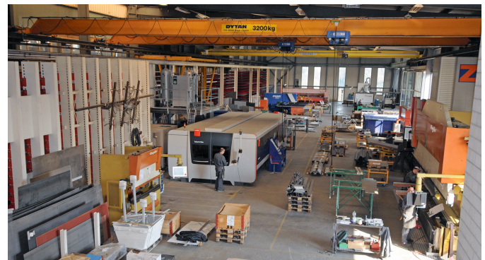
Die Blechbearbeitung, ein wichtiges Standbein des Unternehmens, ist in einer eigenen Halle untergebracht.