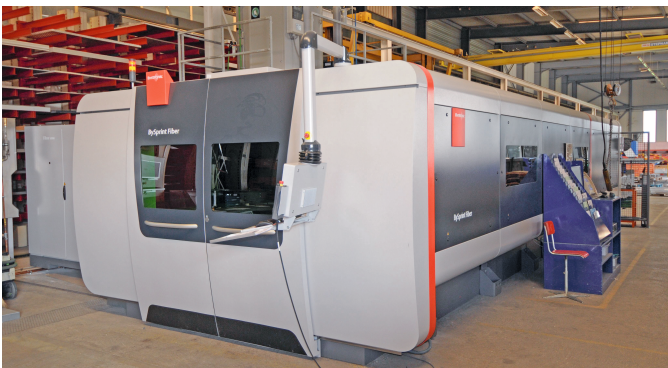
Die 2021 erneuerte Laserschneidemaschine der letzten Generation eröffnete neue, effiziente Möglichkeiten in der Blechbearbeitung.

Zbinden emploie 55 personnes à Posieux, Sutter 43 à Lungern, dont de nombreux serruriers et mécaniciens. «Notre